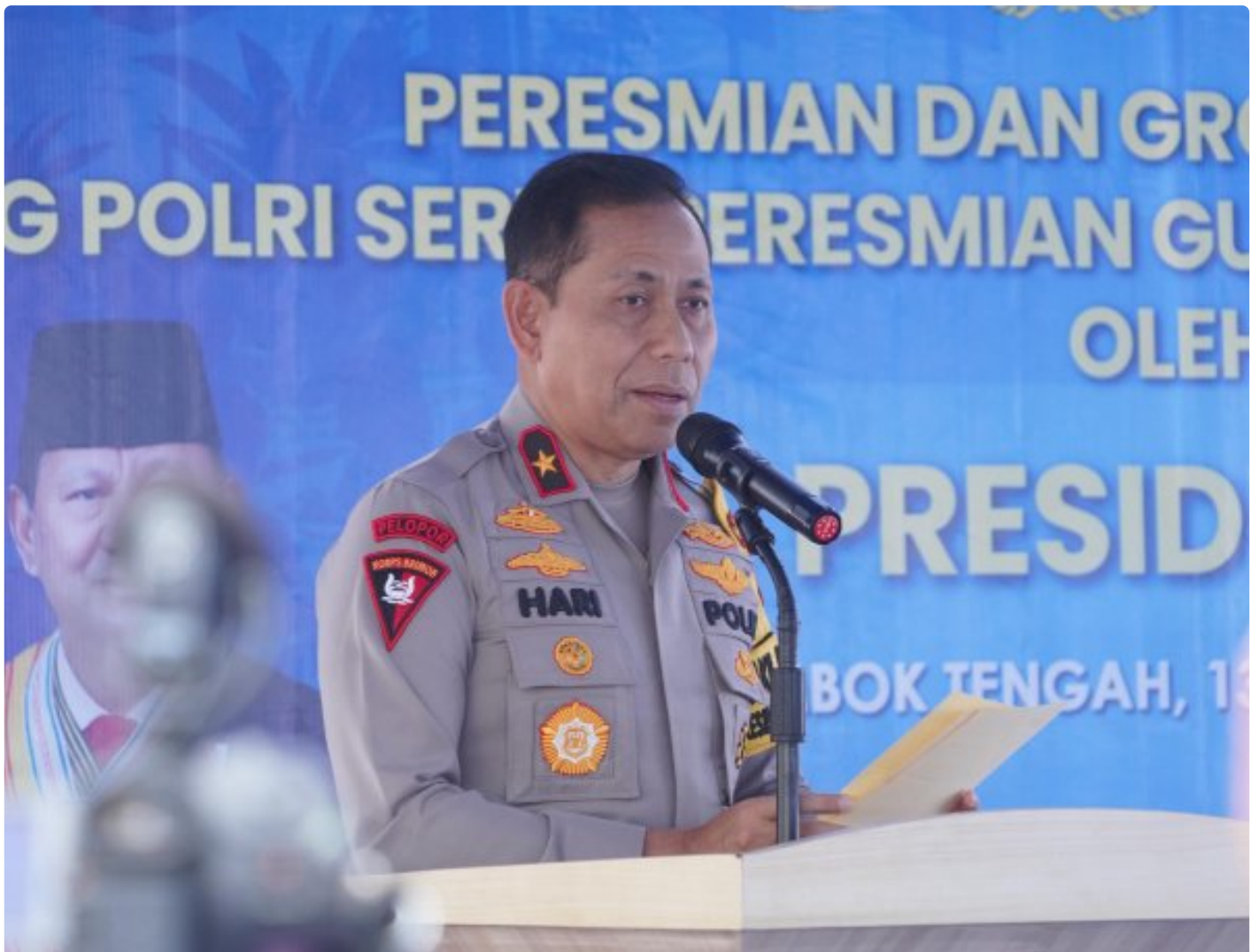
Wakapolda NTB Brigjen Pol. Hari Nugroho, SIK.

Mataram, NTB – Komitmen Polri dalam mendukung peningkatan kualitas sumber daya manusia terus diwujudkan secara nyata. Wakapolda NTB Brigjen Pol. Hari