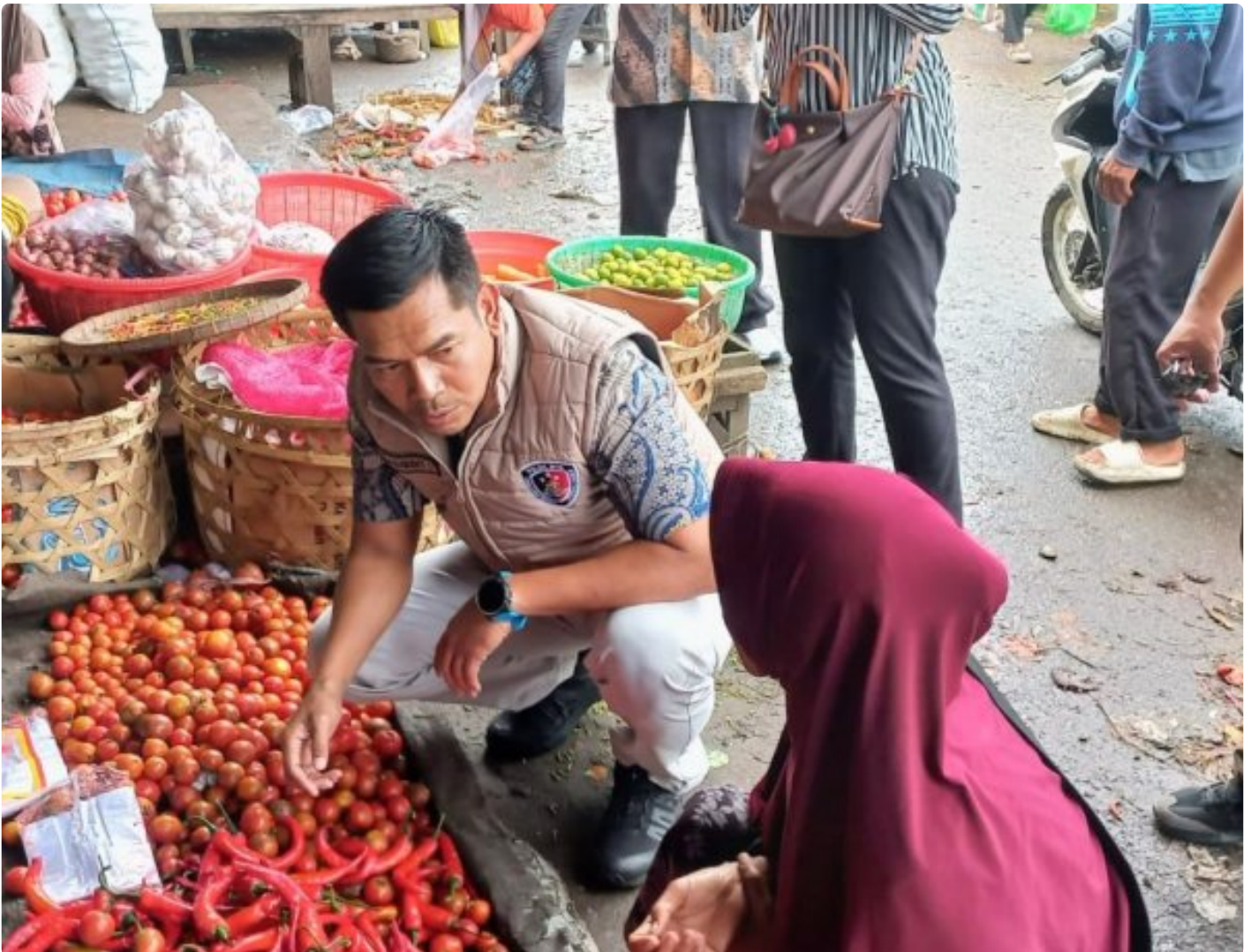
Satgas Saber Keamanan, Mutu dan Harga Pangan Provinsi NTB saat sidak di Pasar Paokmotong Lombok Timur, Jumat (13/02/2026)

Mataram, NTB – Upaya menjaga stabilitas stok, mutu, dan harga komoditas pangan terus digencarkan. Satuan Tugas (Satgas) Sapu Bersih (Saber)